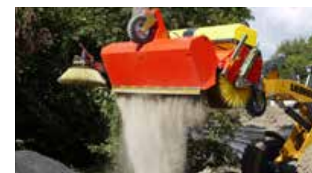
Hydraulische Entleerung des Sammelbehälters