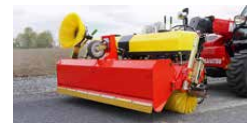
Freikehrmodus, hydraulische Behälterentleerung und drittes Stützrad am Sammelbehälter